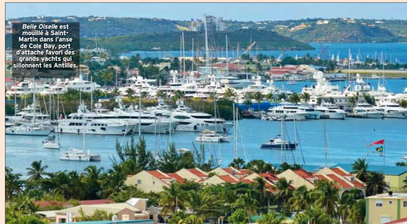
Belle Oiselle est mouillé à Saint-Martin dans l'anse de Cole Bay, port d'attache favori des grands yachts qui sillonnent les Antilles.