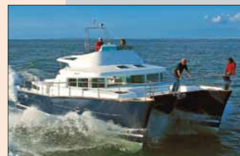
Catamaran de 13 mètres, le Lagoon Power 43 a été lancé en 2000.