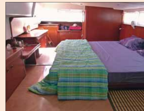
La cloison séparant les deux cabines arrière a été abattue afin de réaliser une master-cabin avec deux mètres de hauteur sous barrots garantis à chaque extrémité. Le confort absolu !

le poids des voiles, le temps passé au moteur alors qu'il s'agit d'un voilier, tout cela fait réfléchir les deux capitaines ! Une fois le bateau vendu, le couple rejoint la France et approfondit sa réflexion.