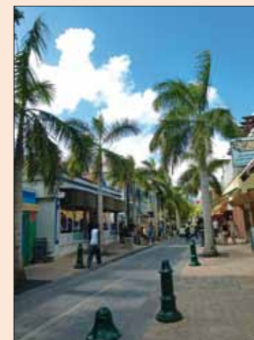
Philipsburg est la capitale de Saint-Martin, côté néerlandais. Les rues sont clean et avenantes.